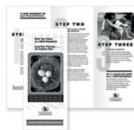
Pliage en deux, en C et en Z