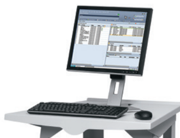
Xerox® FreeFlow Print Server