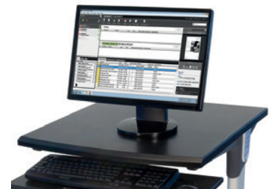
Xerox® EX Print Server, intégrant la technologie Fiery