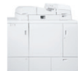
Xerox® Perfect Binder*