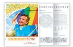
Insertions de couleur, agrafage et pliage en Z format technique