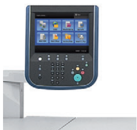
Serveur de copie/d'impression intégré