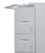
Magasin grande capacité 2 bacs 2 000 feuilles chacun (4 000 feuilles au total) : format A4