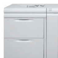
Magasin très grande capacité 2 bacs* 2 000 feuilles chacun (4 000 feuilles au total) : jusqu'au format SRA3