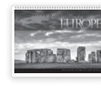
Matrice de perforation