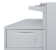
Magasin très grande capacité 2 000 feuilles : jusqu'au format SRA3