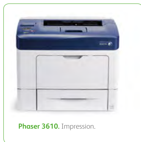
Phaser 3610. Impression.